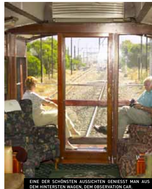
EINE DER SCHÖNSTEN AUSSICHTEN GENIESST MAN AUS DEM HINTERSTEN WAGEN, DEM OBSERVATION CAR.

viel Zeit gemeinsam zelebriert. Kristallglas und edles Silber bestimmen das Bild. Zum Essen gibt es Straussenfilet mit Bokaap-Gewürzen oder Garnelen auf Zitronengras. Die Küche ist leicht, frisch und so vielgestaltig wie die Regenbogennation Südafrika selbst: Austern aus Knysna, Fisch von der Westküste, Impala vom Buschveld, Lamm aus der Karoo, feinste südafrikanische Früchte und Gemüse, dazu vegetarische und koshere Speisen. Dass auch die Weinkarte einen Schaukasten der besten