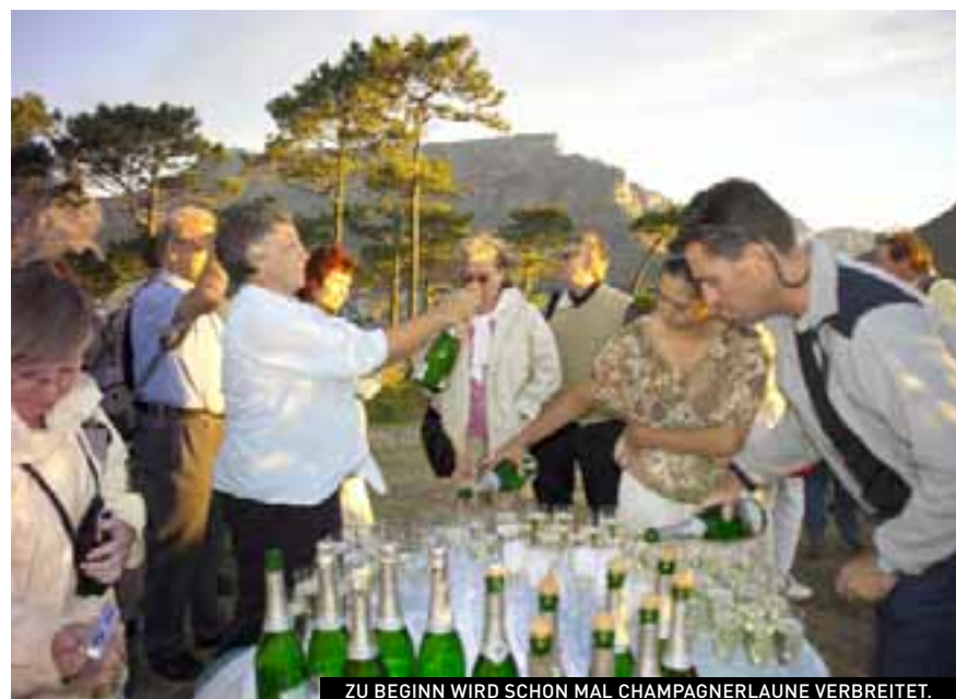
ZU BEGINN WIRD SCHON MAL CHAMPAGNERLAUNE VERBREITET.