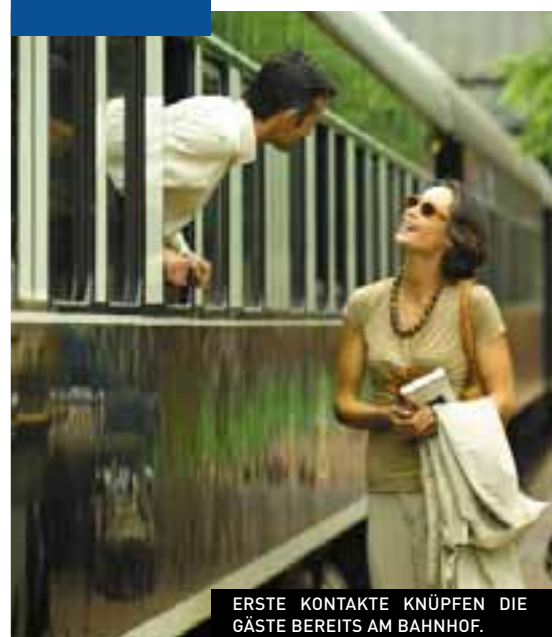
ERSTE KONTAKTE KNÜPFEN DIE GÄSTE BEREITS AM BAHNHOF.