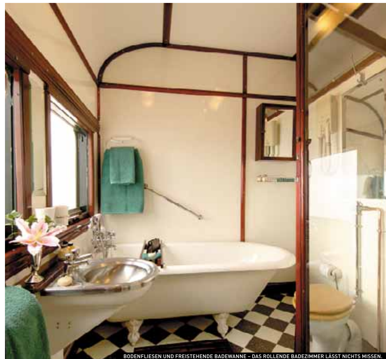
BODENFLIESEN UND FREISTEHENDE BADEWANNE – DAS ROLLENDE BADEZIMMER LÄSST NICHTS MISSEN.

«Vos ist wohl der einzige Bahnbesitzer der Welt, der alle seine Fahrgäste persönlich kennt.»